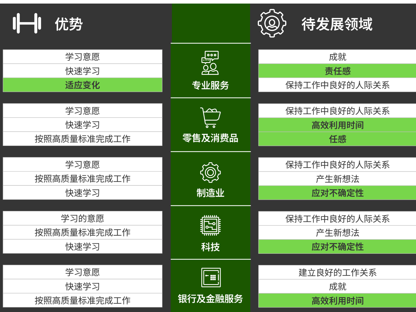
图3. 各行业专业人才关键技能比较

我们发现：各行业的主要优势相对一致，但待发展领域则大相径庭。 责任感、应对不确定性和高效利用时间 被认为是某些特定行业的关键发展领域(图3)。